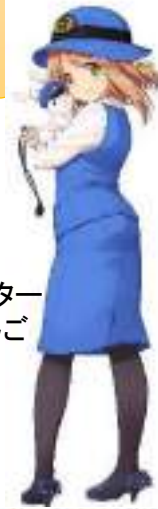
キャラクター 鮎貝りんご