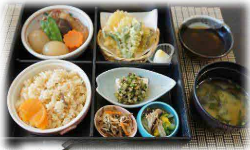
はぎ苑 最大受入人数200席