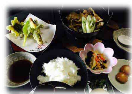
中央会館 最大受入人数150席