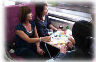
イベント列車の車内風景

羽前成田駅 大正11年に建てられた木造駅舎。 2015年国の登録有形文化財に登録