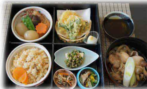
はぎ苑 最大受入人数200席