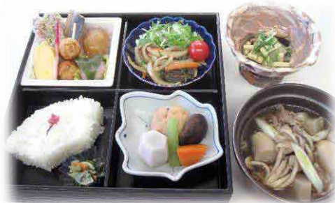
タスパークホテル 最大受入人数300席