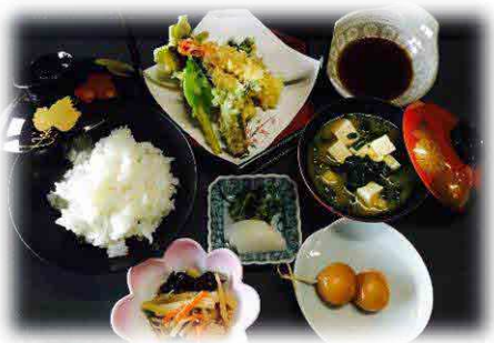
中央会館 最大受入人数150席