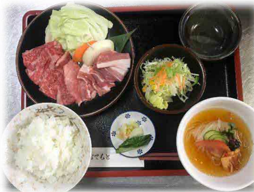
焼肉 頓珍館 最大受入人数50席 【米沢牛又は山形牛と 三元豚カルビの焼肉膳】