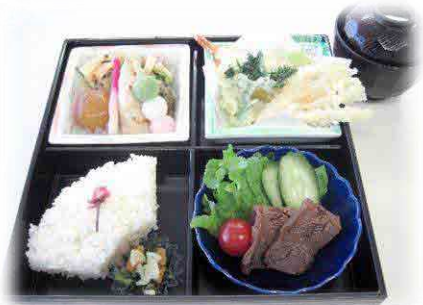
タスパークホテル 最大受入人数300席