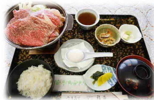
料亭 福昌 最大受入人数80席 【米沢牛すき焼き膳】